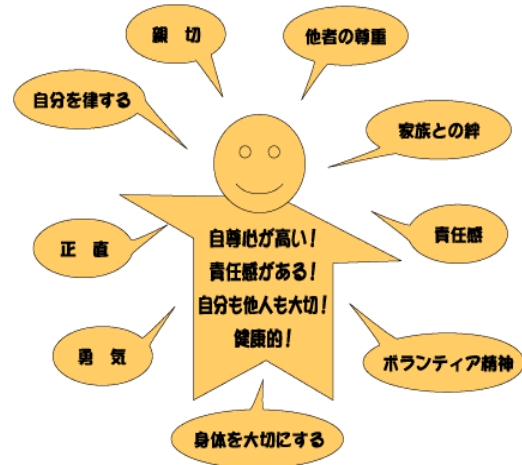
プログラムの9つの価値観

二日間の研修では、下記のプログラムの構成やエッセンスを学びます。また、実際に模擬授業を体験（教師役と子ども役の両方を体験）することで、授業にすぐに活用できます。