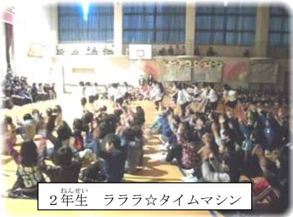
ねんせい 2年生 ららら☆タイムマシン