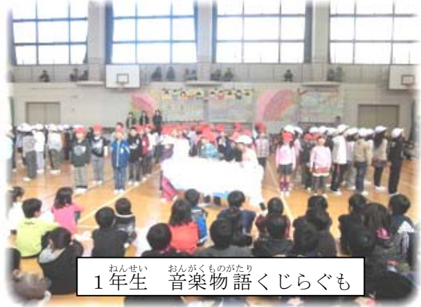
ねんせい 1年生 おんがくものがたり 音楽物語くじらぐも