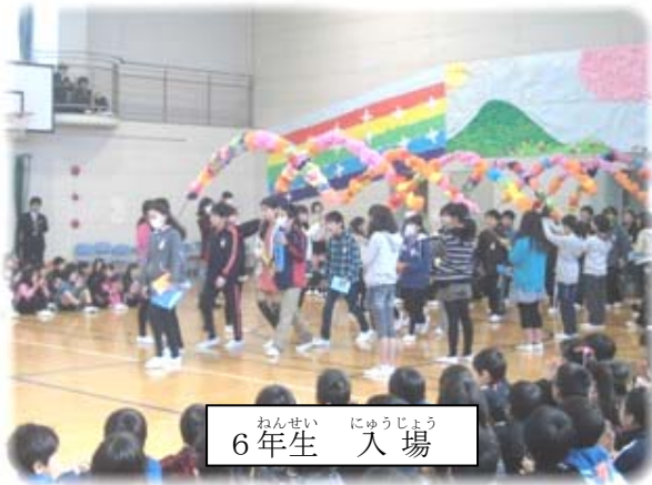
ねんせい 6年生 にゅうじょう 入場