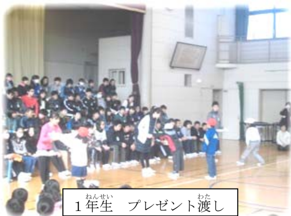
1年生 プレゼント渡し