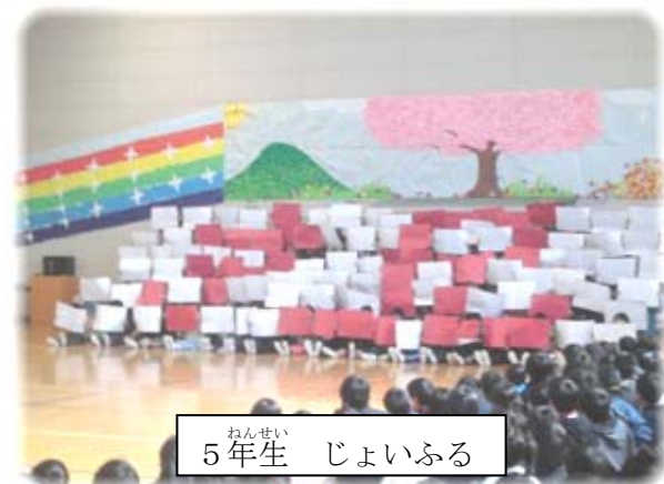
ねんせい 5年生 じょいふる