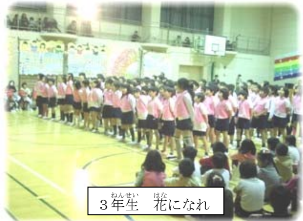
ねんせい 3年生 はな 花になれ