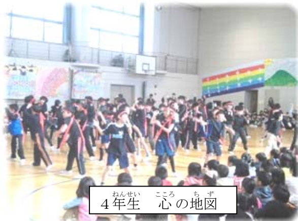
ねんせい 4年生 こころ 心の地図 ちず