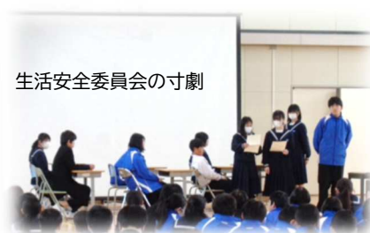
生活安全委員会の寸劇