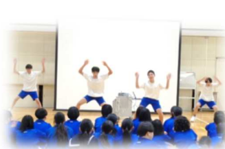
ハカ！ダンス！バレエ！