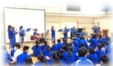
吹奏楽部名物「ウルトラソウル！」

先週の朝明中は学年末のイベントで大盛況でした。それぞれの学年の室長会が中心となって企画運営した行事に、この一年の成長を感じ、とても嬉しくなりました。笑顔、つながり、表現力。すごいよ、朝明っ子！