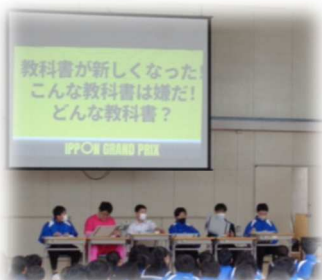
朝明中版 IPPON グランプリ！