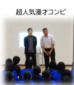
超人気漫才コンビ