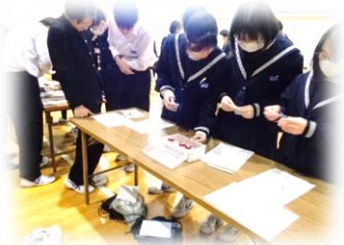
4種類のプラスチックを分別する実験。リサイクルに直結します

3年生の理科では「持続可能な社会をめざして」をテーマに、科学技術の発展と人間生活との関わり方や、自然環境の保全と科学技術の利用のあり方について学びます。26日(月)には、四日市市と脱炭素社会関連の協定を結んだ DIC 株式会社さんにお越しいただき、地球環境やリサイクルについての出前授業を実施しました。名付けて「こどもよっかいち CO 2 ダイエット作戦」(市の環境部さんの事業です)。