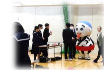
こにゅうどうくんも応援に来てくれました

家庭から出るゴミを減らすこと、ゴミの再資源化をすすめること。考えることも、できることもたくさんあります。「四日市市ゼロカーボンシティ宣言」の中で 2050 年までに CO 2 排出量実質ゼロを目指す四日市市。それを担う次世代の市民として、中学生たちの学びはとても大切です。貴重な体験を提供して下さった DIC のみなさん、市役所のみなさん、ありがとうございました。