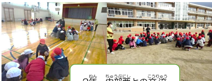
2年 中部西との交流