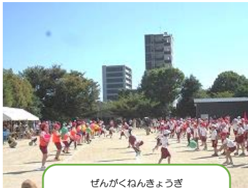
ぜんがくねんきょうぎ 全学年競技 アイスマイル