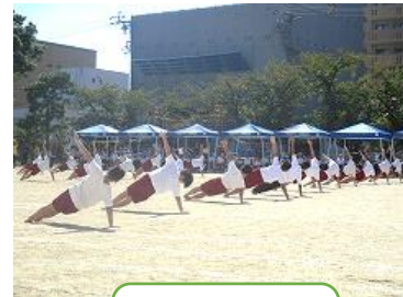
こうがくねんひょうげん 高学年表現