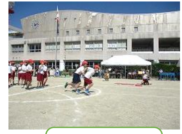
ちゅうがくねんだんたい 中学年団体