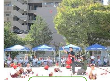
ていがくねんだんたい 低学年団体