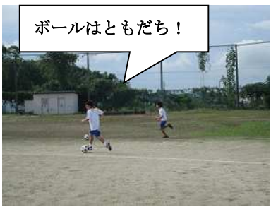
ボールはともだち！