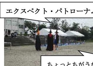
ホグワーツの校長先生?