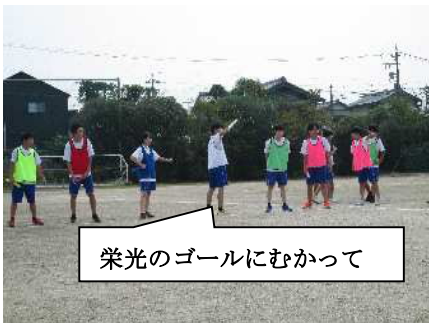
栄光のゴールにむかって