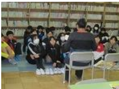
ねんせい 6年生 ブックトーク