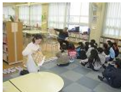
れきし ほん かいせつ むかしばなし るいじせい しょうがい 歴史の本の解説から昔話の類似性を紹介