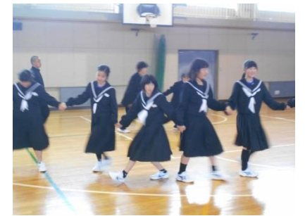
フォークダンスの練習の様子