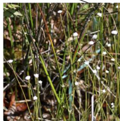
シラタマホシクサ群落 (西部指定地)

この植物が、とてもきれいで見惚れて、御池沼沢の保全活動に参加される人もいますそうです。