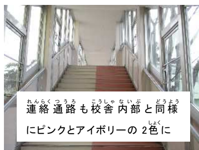
連絡通路も校舎内部と同様にピンクとアイボリーの2色に