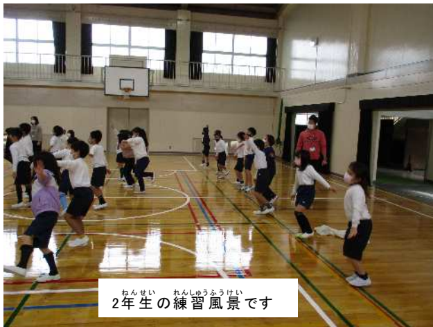
2年生の練習風景です

改修工事中は、体育館開放の中止や周辺の通行規制など、諸方面で大変ご迷惑をおかけしました。下の写真では、LED照明のダイヤモンドのような輝きや、新たに磨きかけた床面の光の反射もご覧ください。