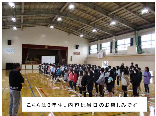
こちらは3年生。内容は当日のお楽しみです