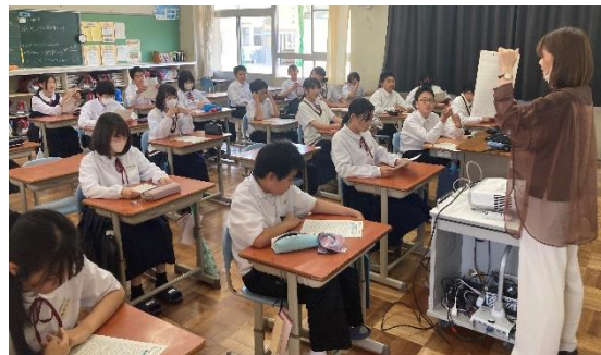
左の写真：1組 右の写真：2組 初めてのテストに向けて、担任の先生と一緒にテストの受け方について確認しました！