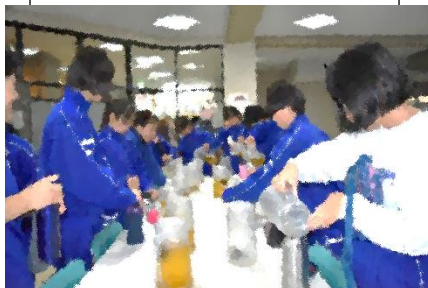
水筒へお茶を入れました