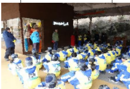
スキー教室開校式