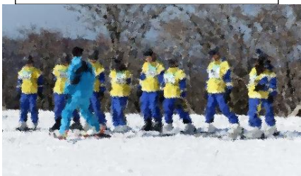
インストラクターの話を しっかりと聞いています