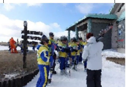
インストラクターに挨拶