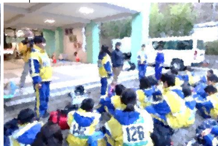
「自然の家」の入所式