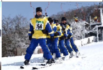
経験者はトレインもできます