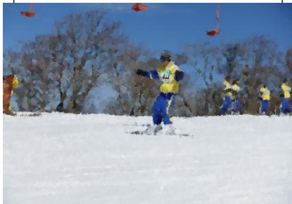
ストックなしで滑ってます