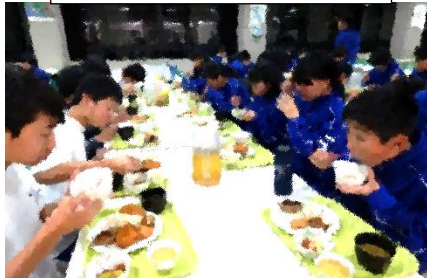
みんなそろっての夕食