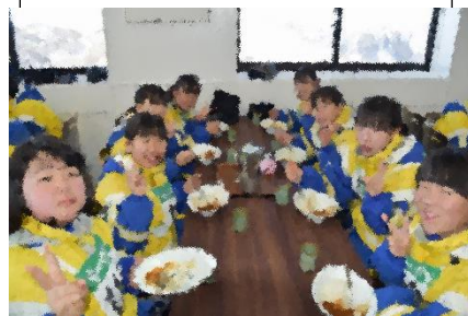
班でそろっていただきます