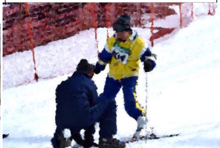
板を履くのに苦労しました