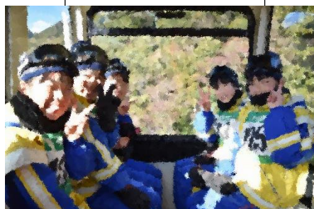
ワクワクしてます