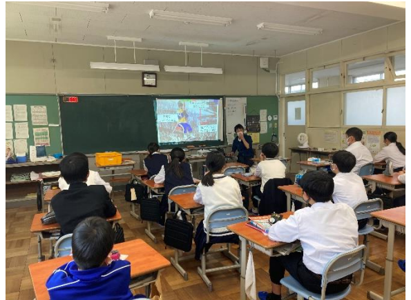
〈スキー事前学習の様子〉

1月31日(月)から二日間御在所スキー場でのスキー実習を行います。宿泊はなくなってしまい、少し残念な気持ちもありますが、しっかりスキーの練習をして楽しんでほしいと思います。スキー場は現在60cmほどの積雪で、樹氷も一部見られるそうなので景色を楽しみながらロープウェイに乗ってみてください。先週の金曜日に、スキー場で気を付けるべきことについて寺井先生から教えてもらいました。雪道を歩くときや、リフトに乗った時など、あぶない行動をしないように気を付けましょう。また、忘れ物にも気を付けましょう。手袋やゴーグルを忘れると、実習ができませんよ。