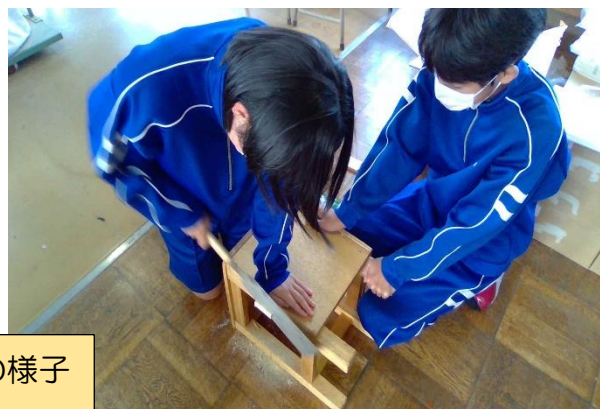
技術の製作の様子