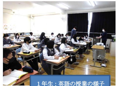
1年生：英語の授業の様子

来週5月23日(木)、24日(金)は、1学期の中間テストです。当日まで残りわずか、計画的に勉強を進めましょう！特に初めての定期テストとなる1年生にとっては計画表を作り、部屋の目につきやすい場所に貼って、あと何をしないといけないか確認しながらテスト勉強をするとよいでしょう。もちろん、毎日の授業の予習や復習も重要です。さあ、あと少しがんばりましょう！