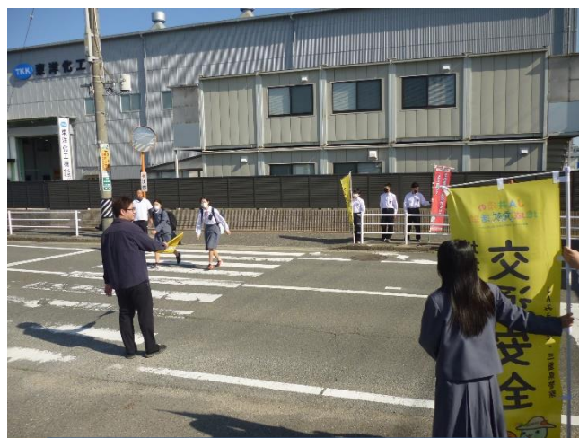
生活委員会：朝の交通安全&挨拶運動の様子