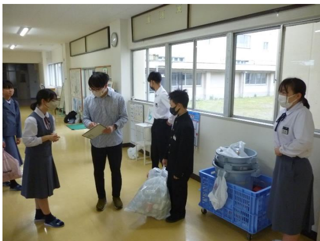
福祉委員会：朝の空き缶回収運動の様子