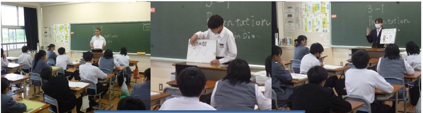
3年生：理科の授業で個人の研究をプレゼンしている様子

3年生の理科では、「生物」の単元で学習した内容から、自分が興味を持ったことや疑問に思ったことについて調べ学習して、それをクラスでプレゼンテーションするという授業をしました。