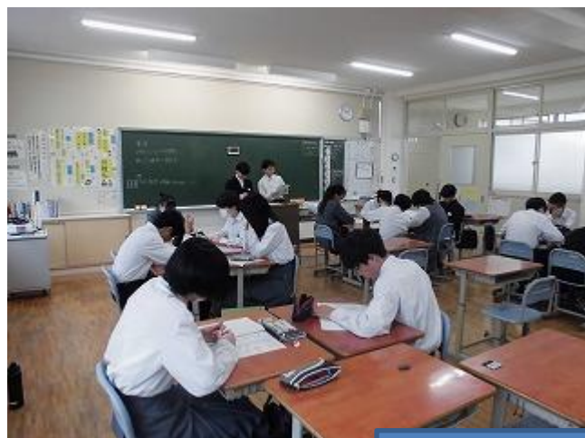
生徒総会に向けて：各学級での活動の様子