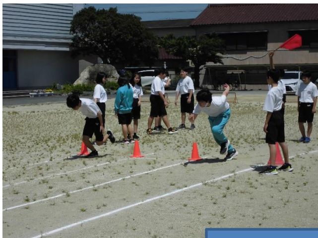
体育の授業：体力テストの様子