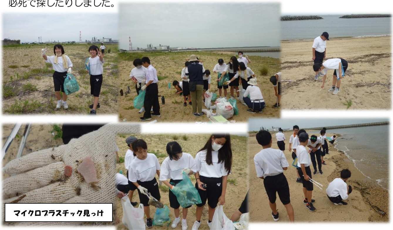
マイクロプラスチック見つけ

7月3日（月）、1年生が磯津の海岸で清掃活動を兼ねた環境学習を行いました。当日は、熱中症警戒アラートが発令される大変蒸し暑い日になりましたが、時間いっぱいごみを拾ったり、大きな環境問題になっているマイクロプラスチックを必死で探したりしました。