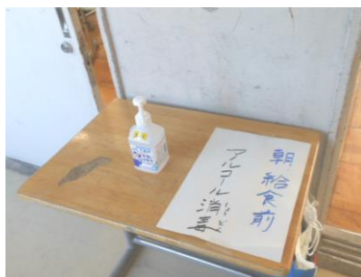
教室へ入る前に アルコール消毒