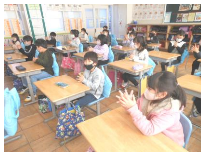
Zoomを使って 全校児童に手洗い指導