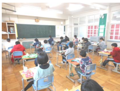
給食は2教室に分かれて 黙って前向きで