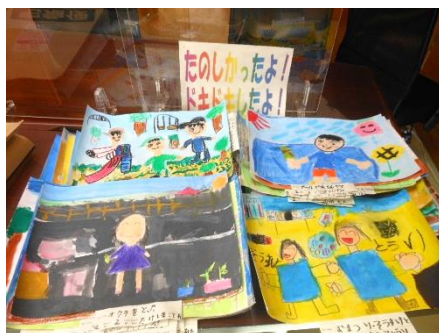
楽しかったこと(2年)