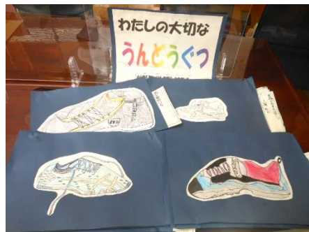
私の大切な運動ぐつ(4年)