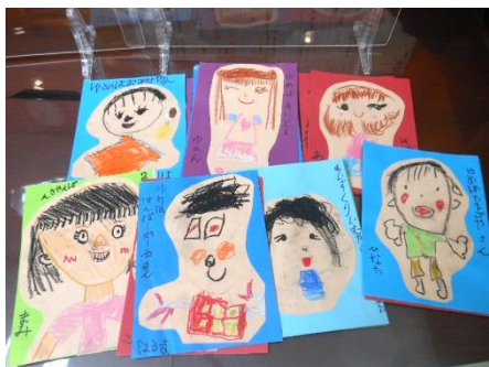
大きくなったら・・・(1年)