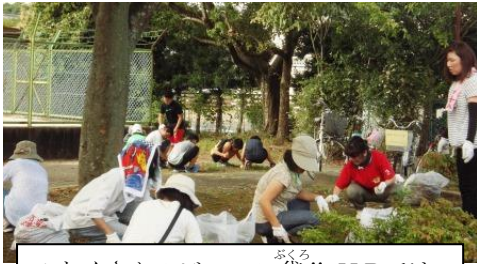
*たくさんのビニール袋!! HPでは、カラー写真で見られますよ。

～ 9/3(土) クリーン作戦2 (PTA親子奉仕作業), ありがとうございます～