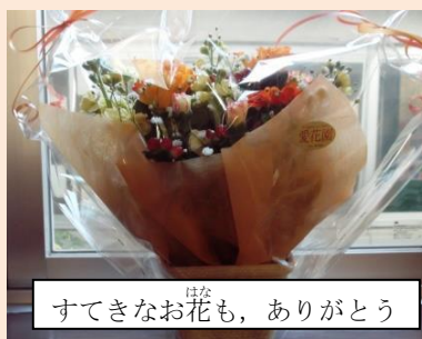
すてきなお花も，ありがとう

～ 私たちも，みなさんのおかげで，楽しい日々を送らせてもらいました。こちらこそありがとうございます。私も，卒業です。お互い，元気でやりましょう。～