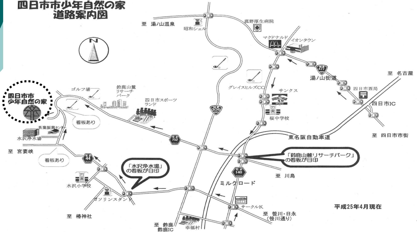
四日市市少年自然の家 道路案内図