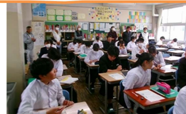
CS運営協議会による参観