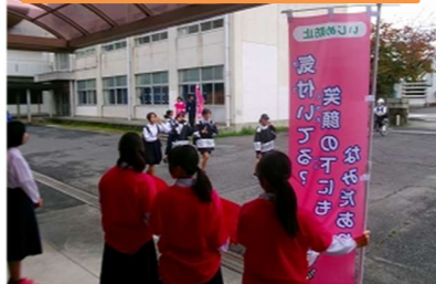
ピンクシャツ運動