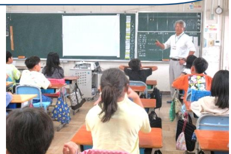
4年生 出前授業「ネットモラル」