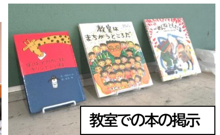
教室での本の掲示

【図書ボランティアの本の紹介】6/15の授業参観では、いろいろな本の楽しみ方を伝えてもらいました。