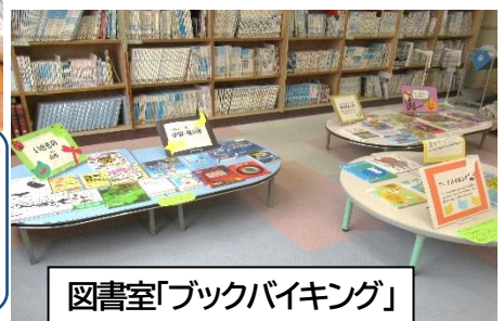
図書室「ブックバイキング」