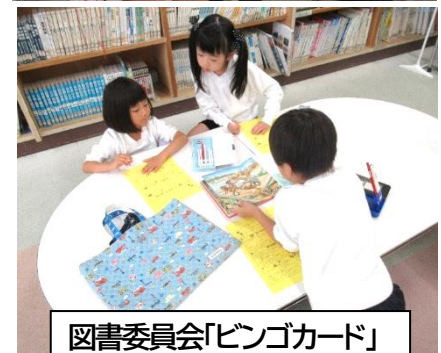
図書委員会「ビンゴカード」

更に、読み聞かせは、聞く力が身につく、子どもだけではなく、大人も心が安らぐのだそうです。