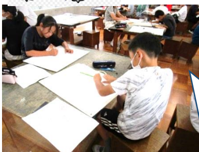
5年生 図工「防犯ポスター」

授業参観日に合わせて、学校運営協議会を開催しました。以下のよ うなご意見以外に、安全面で子どもたちの気になる姿も教えていただ きました。課題点については、改善に努めてまいります。