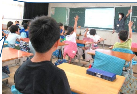
3年生 出前授業「メディアリテラシーと人権」