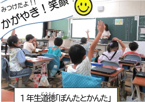
1年生道徳「ぼんたとかんた」

また、「命の尊さ」を考える授業や「自己理解・他者理解に繋がる学習」、 或いは「自分たちの課題について話し合う活動」等が公開され、豊かな心の育成を目指した本校の取り組みを知っていた たく機会となり、嬉しく思いました。