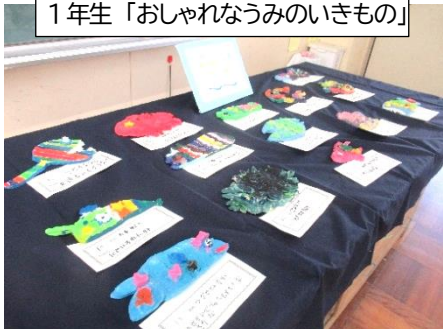
1年生「おしゃれなうみのいきもの」