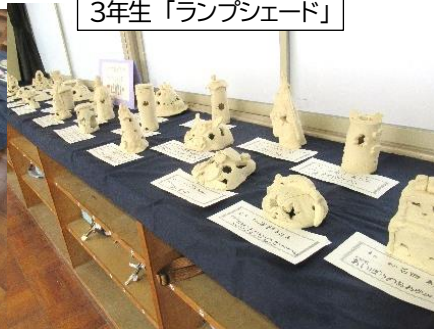
3年生「ランプシェード」