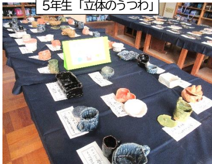
5年生「立体のうつわ」