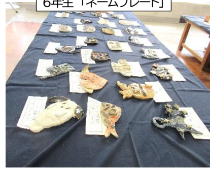
6年生「ネームプレート」