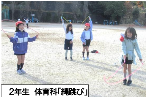
2年生 体育科「縄跳び」

この看板に込められた願いは、「この地域の子どもの命を守ること」です。冬休みに入ると少し気持ち緩みがちとなります。防犯や交通安全に十分気を配り、安全に元気で冬休みを過ごしてください。