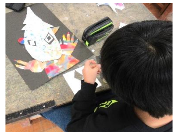
4年生 図工科「真夜中のピエロ」

←この写真、何をしているのかという図工科で作品を完成させた子どもたちが、端材となった紙片の形や色から見立てたものを作って、黒板に貼りに来ている様子です。残った材料もゴミにせず、図工科の目指す「ものづくり」の楽しさを味わうことに利用している姿が素敵です。子どもたちの発想の豊さが輝き、笑顔が広がっていました。