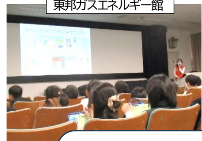
東邦ガスエネルギー館