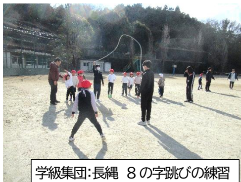
学級集団・長縄 8の字跳びの練習

月・火は、学級（学年）ごとに、長縄を使って8の字跳びに挑戦しています。1年生や2年生では、6年生が回してくれる縄の中へ、タイミングをはかって、怖さを振り払うように「えいっ」と跳び込んでいく姿が時折みられ、微笑ましく素敵です。