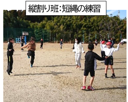
縦割り班：短縄の練習

異学年で、技を競い合ったり教え合ったりして、誰か一人ができるようになった喜びを、同じ班のなかまで幾倍もの喜びにして味わってほしいと願っています。また、木・金は、運動場に縄跳びの練習台（ジャンプ台）を置きます。皆さん、たくさん使って技を磨いてくださいね。