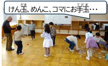
けん玉、めんこ、コマにお手玉・・・