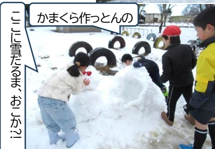
よっしや、雪集めてくるわ

◆お礼とお願◆先週は、子どもたちの登下校の安全確保に、地域、保護者の皆様がたくさん支援いただきました。心より感謝申し上げます。なお、臨時休業に伴い、フリー参観等が延期となりました。ご理解・ご協力をお願いします。