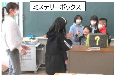
ミステリーボックス