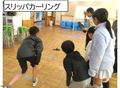
スリッパカーリング

掃除を一緒に行っている縦割りの班で、代表委員会の子どもたちが考えたゲームを楽しみながら校舎を巡りました。ゲームは、「フリースローゲーム」「的当てゲーム」「ボーリング」「ミステリーボックス」「スリッパカーリング」「ゴキブリたたき」の6つでした。代表委員会の子どもたちが作った景品も準備されており、それを喜んでいる子どもたちもたくさんいました。1年生の作文を紹介します。